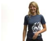
Scout T-shirt kort ärm (kä) insvängd