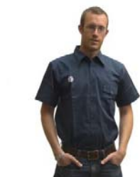
Scoutskjorta rak kort ärm