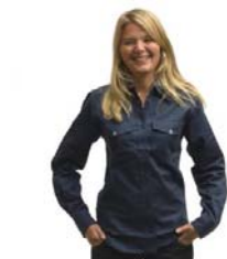
Scoutskjort rak lång ärm