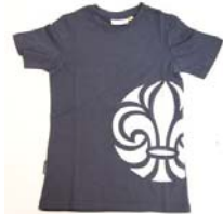
Scout T-shirt barn kort ärm (kä) insvängd