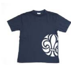
Scout T-shirt barn kort ärm (kä) rak