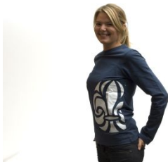
Scout T-shirt lång ärm (lä) insvängd

MÄTTABELL SCOUT T-SHIRT KORT (KÄ) & LÅNG (LÄ) ÄRM 2007