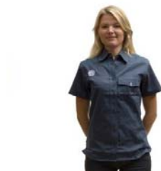
Scoutskjorta insvängd kort ärm