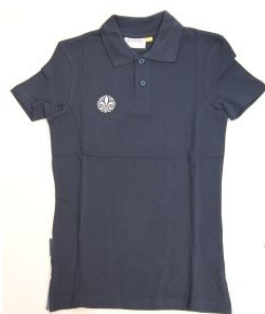
Pikètröja barn invängd