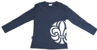
Scout t-shirt barn lång ärm (lä) rak