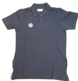
Pikètröja barn rak