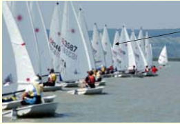
Seminário Regra 42 / Maio 2003 / A. Goulartt