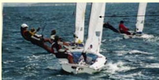
Seminário Regra 42 / Maio 2003 / A. Goulartt