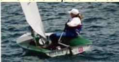
Seminário Regra 42 / Maio 2003 / A. Goulartt