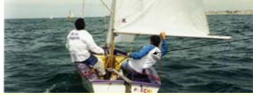
Seminário Regra 42 / Maio 2003 / A. Goulartt