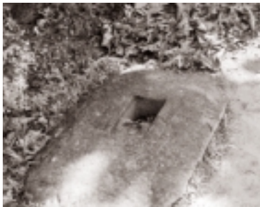
පැරණි වැසිකිලි ගලක්

“ජලය” හෙවත් “අඹ” සෙලවෙන ස්ථානය යන ඉතා ආකර්ශණීය අඩි 60 පමණ උස සොහොවික ගලෙන් සැදුණ ආරූක්කුවක් යටින් හොළොම්බුව ස්ත්‍රීපුර රජමහා විහාරයට පිවිසිය යුතුය.