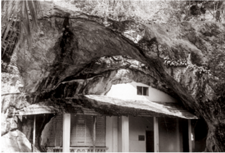
ගල්ලෙන් ආරූක්කුවක් තුළ පිහිටි විහාරස්ථානය

ඩී. ඩී. ඇල්කඩුව (ලේක්හවුස් කර්තෘ මණ්ඩලය)