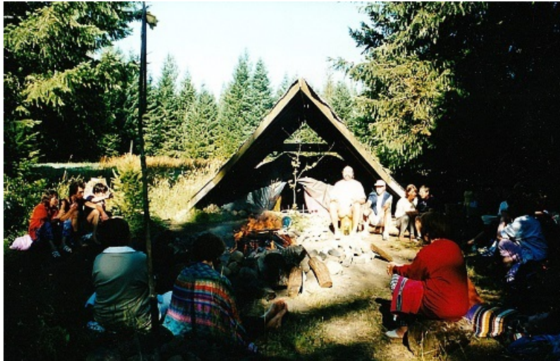
Groep maakt zich klaar voor de zweethut ceremonie

Sandra (Belg) en Margie Carlson (Amerikaan) waren de vuurvrouwen die de ruimte buiten de zweethut bewaakten en het vuur gaande hielden. Urenlang werden de voorbereidingen gedaan. Het vuur werd opgebouwd, gestart en onderhouden. Grote stenen werden in het vuur gelegd tot ze zo heet waren dat het leek alsof ze net waren afgekoeld van magma.