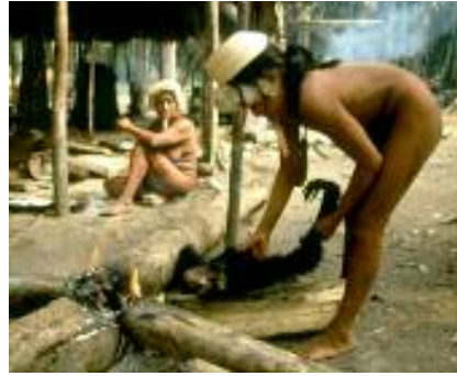
Ateşte Orangutan Pişiren Yerliler

Kıyafet giyinmeyen, tüm ihtiyaçlarını ağaçtan temin eden, saf ve temiz ruhlu ancak güçlü ve sağlam karakterli bu yerlilerin barakalarında bir kaç geçirirken, kendilerine yıllardır savaştıkları yabancı orman düşmanlarını sorduk. Quartz gibi değerli yer altı taşlarından, en kıymetli yer üstü ağaçlarına kadar her türlü zenginliğin bu bölgede bulunduğundan dünyanın gözünün Amazon’larda olmasının doğal olduğunu belirttiler. Sting ve vakfının başlattığı kampanyaya Greenpeace gibi diğer örgütlerinde katılması bu katliamı nispeten azaltmış.