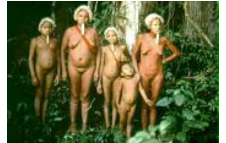
Çıplak Amazon yerli ailesi

Hakikaten civarda gördüğümüz madenci, inşaatçı gibi ormana zarar veren beyaz işçiler bile bu tip çalışmaların azaldığını fakat bitmediğini özellikle belirttiler. Kendilerinin de bu işleri para kazanmak için ama gönülsüz yaptıklarını söylediler. Şimdiye kadar yapılan katliam toplamının tüm Amazonların ancak 1000’de 1’i olduğunu fakat çevrecilerin işi biraz gevşetmesi halinde tekrar batılı ülkelerin buraya akın ederek bu oranın hemen büyüebileceğini itiraf ettiler. Nükleer bomba atmadıkça yine de bu ormanı bitiremezler diyorlar. Gerçi, kesilen ağaçlar kısa bir zaman sonra insanoğlundan intikamını alıyor ama bu yöredeki Amazon yerlileri de bu işi ağaçlara bırakmayacak kadar inatçı.