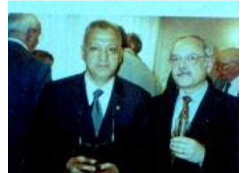
Kulüp Başkanları bir arada