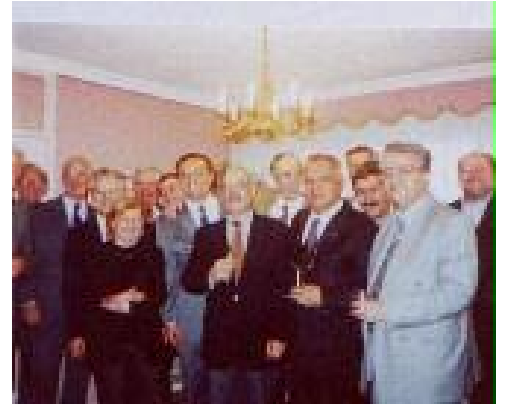
Nantes Ouest Lions Kulübünün Kulübümüzü Karşılama Kokteyli