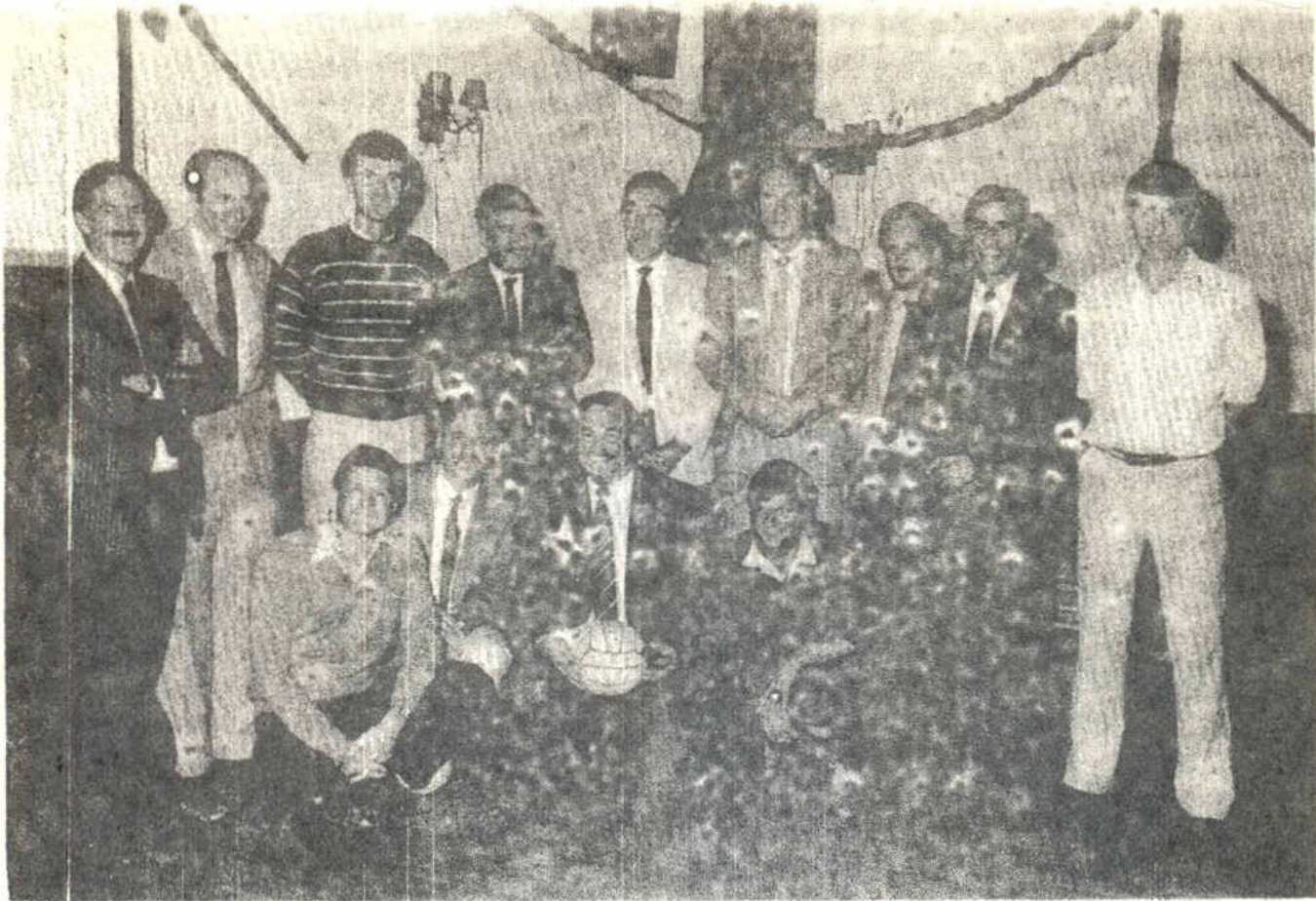
Kijk eens hoe de jongens zijn uitgegroeid!!!!!!