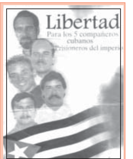
Libertad Para los 5 compañeros cubanos prisioneros del imperio

La lucha a favor de ellos no sólo debe estar encaminada a la celebración de un nuevo y justo juicio, sino a liberarlos de inmediato.