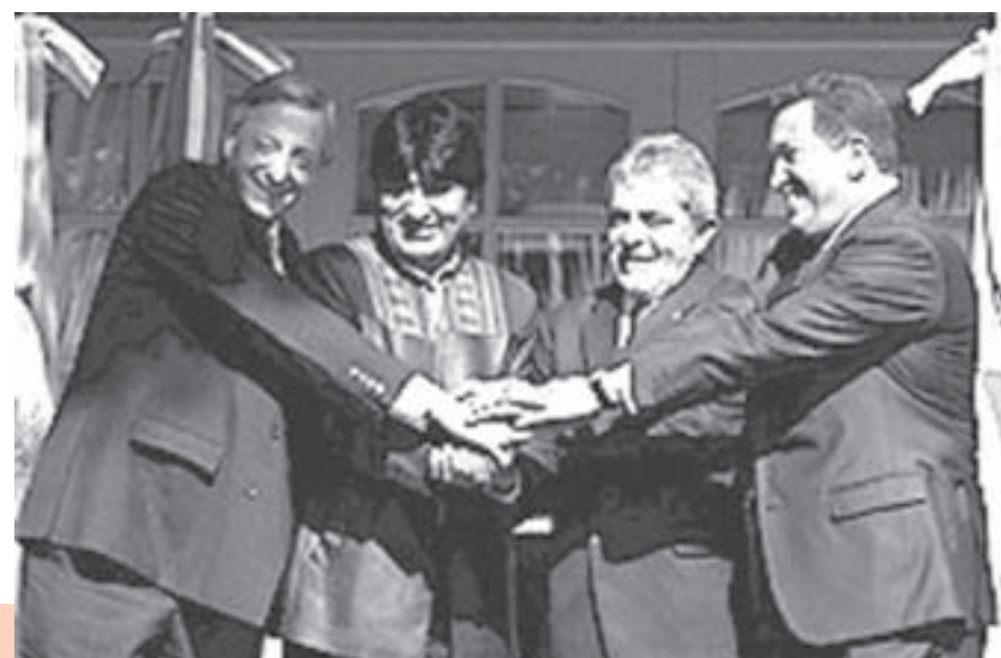
Presidentes Kirchner, Argentino, Evo Morales, Bolivia, Lula Da Silva, Brasil, y Chávez, Venezuela, promoviendo la interacción latinoamericana.

En Palestina destaca el triunfo de Hamas y pelean por un Estado