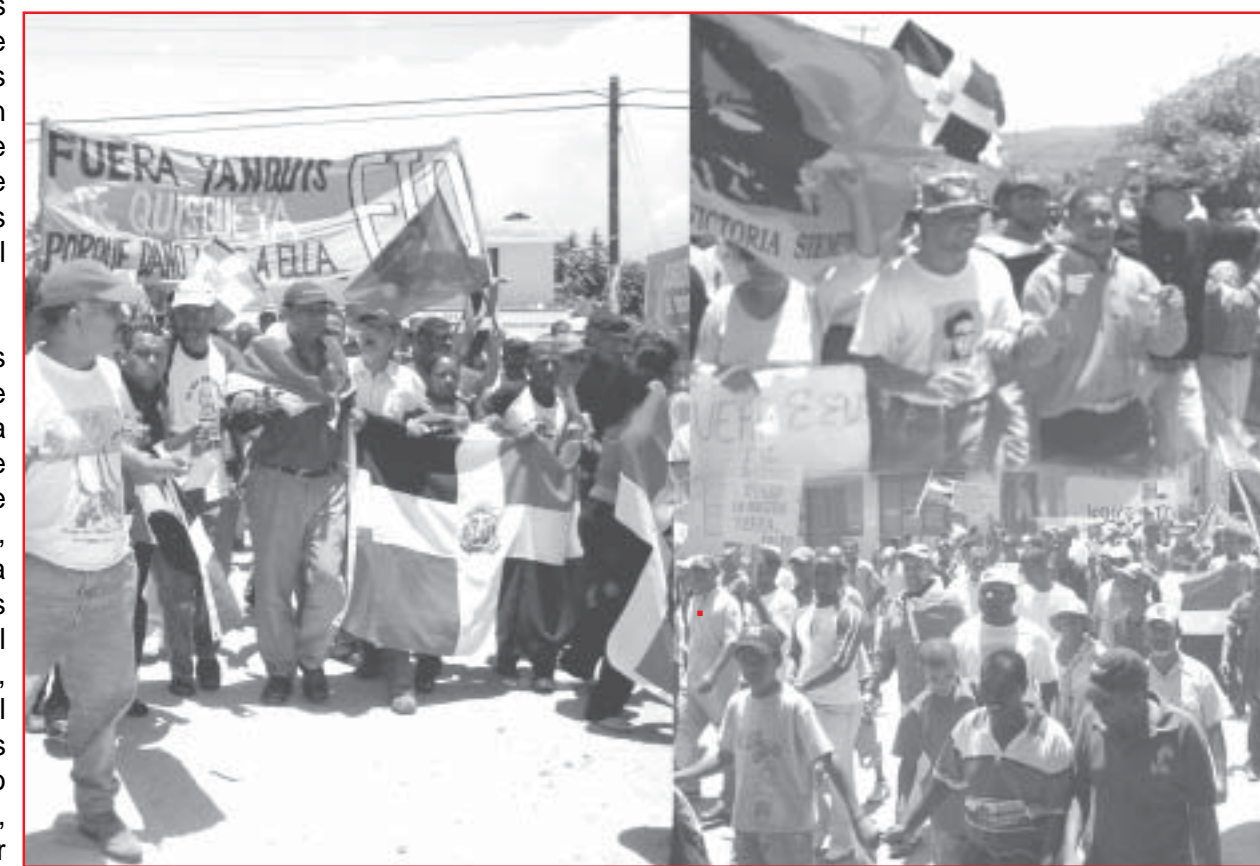
IMAGENES DE LA CARABANA PATRIÓTICA REALIZADA EN BARAHONA EL 29 DE ABRIL PASADO.

Continuando con la cadena de agresiones que no excluye casi a ninguna nación de América y el Caribe, en sintonía con la estrategia de "guerras preventivas" que ejecuta la administración del fascista George Bush, atormentado por la crisis moral, económica, política, social que abate a la sociedad norteamericana, por las crecientes luchas en todos los confines del planeta y el repunte de los procesos socialistas, democráticos y antineoliberales en el continente, el imperialismo incrementa sus maniobras militares en la región preparando una agresión militar contra Cuba, Venezuela, Haití o cualquier otro país que decida tomar el camino de la independencia y la libertad.