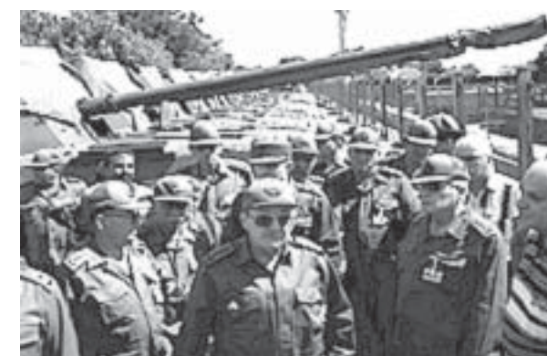
Raúl Castro y otros comandantes de la revolución cubana en movilización permanente.

"Más de 3,200 uniformados han sufrido lesiones en la cabeza, muchos de ellos con daños cerebrales, ...requiriendo de por vida cuidados de salud valorados entre seis cientos mil y cinco millones de dólares por persona".