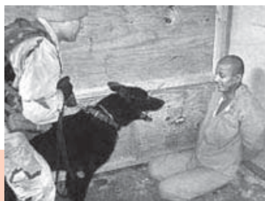
He aquí la cobardía de los soldados invasores en Irak contra un detenido.

Aunque el poder imperial y conservador predomina en el mundo, muestra fisuras y debilidades crecientes, al tiempo que se incrementan las luchas de las/os oprimidos. Razones sobradas para ser optimistas!