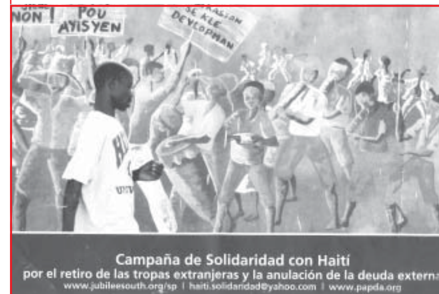
Campaña de Solidaridad con Haití por el retiro de las tropas extranjeras y la anulación de la deuda externa. www.jubileesouth.org/sp | haiti.solidaridad@yahoo.com | www.papda.org

El PTD, ml, aportará para que ambos eventos sean exitosos!